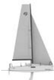
FIRST 27 SE