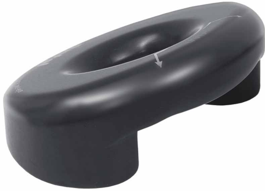
Antal Dyneema Pad-Eye